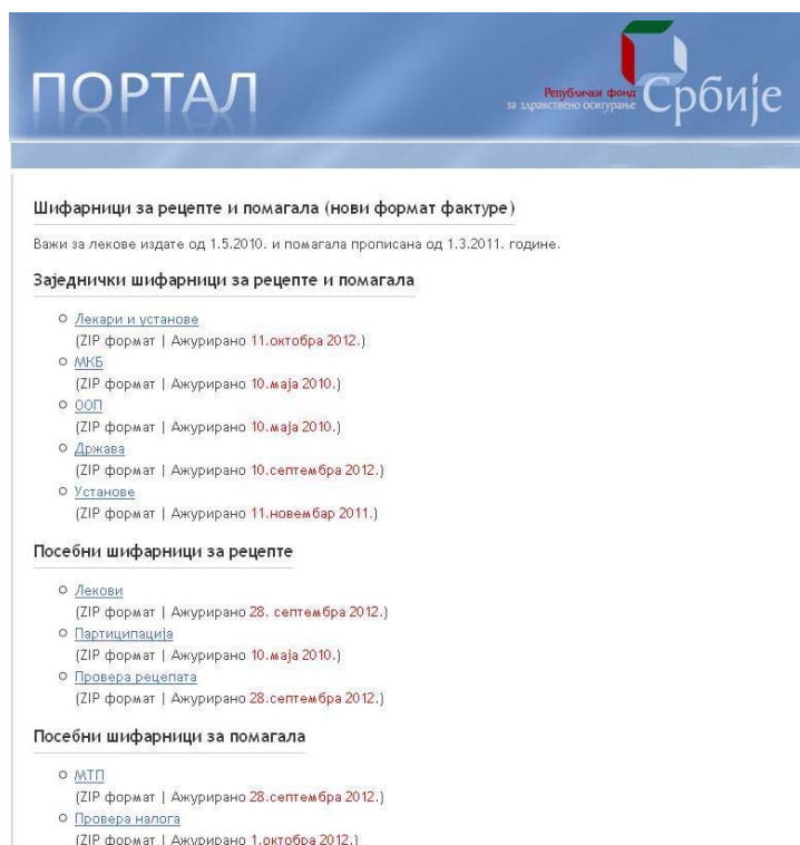
Слика 3 Портал РФЗО → Шифарници за рецепте и помагала

http://portal.rfzo.rs/receptipomagala-novisifarnici