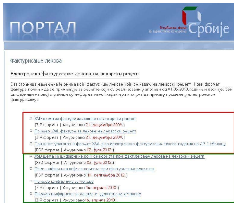
Слика 2 Портал РФЗО → Техничко упутство и опис електронских шифарника