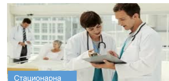
Стационарна здравствена установа

У случајевима када је здравствено стање осигураног лица такво да у току стационарног лечења захтева и лечење хипербаричном оксигенацијом, а здравствена установа у којој се осигурано налази на стационарном лечењу не може да пружи услуге хипербаричне оксигенације на терет средстава обавезног здравственог осигурања, обавезна је да осигураном лицу обезбеди такво лечење у здравственој установи у којој се обезбеђује здравствена услуга хипербаричне оксигенације на терет средстава обавезног здравственог осигурања.